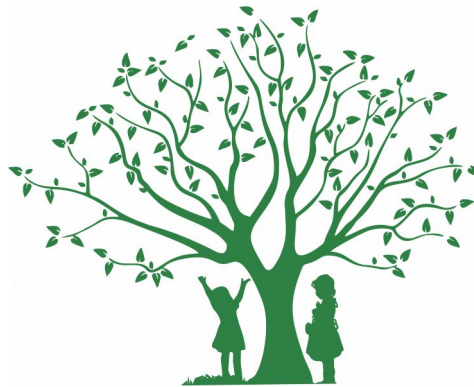
Verein Blätterdach e. V.